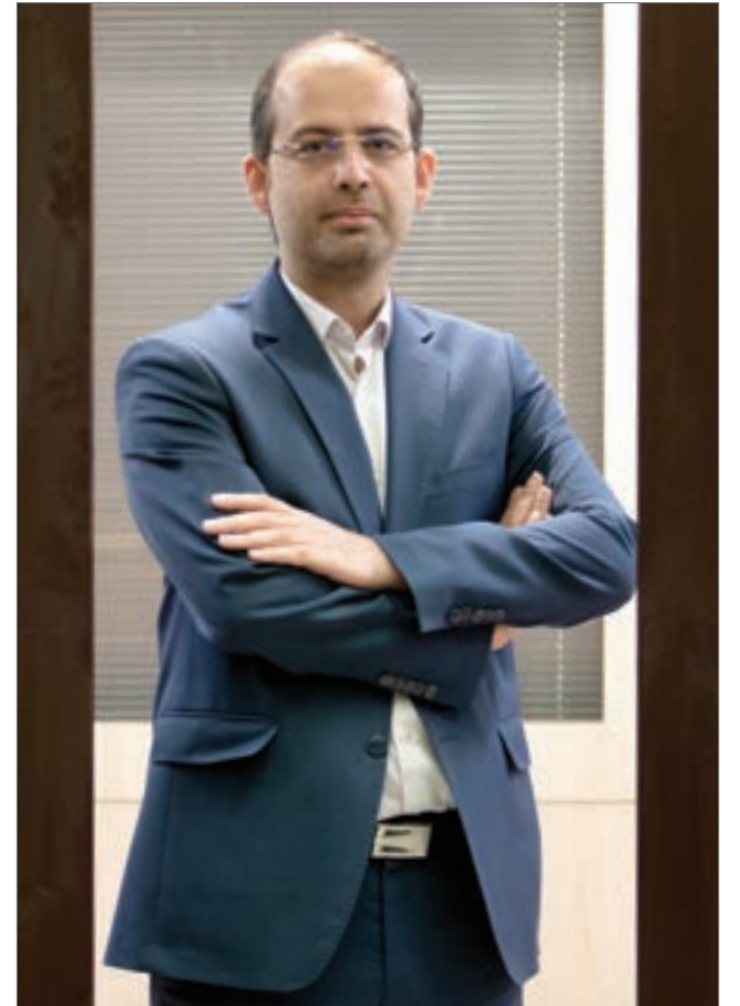
مدیرعامل شرکت مشاور سرمایه‌گذاری دیدگاهان نوین خبر داد: